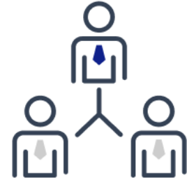
1つのIDで 複数契約をまとめて管理