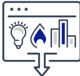
CSV、使用量証明書の ダウンロード