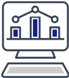
エネルギー (料金、使用量) の見える化

「myTOKYOGAS ビジネス」は、法人・個人事業主のお客さま向けに便利な機能を搭載した、東京ガスのWeb 会員サービスです。(登録無料)